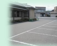
駐車場約20台収容可