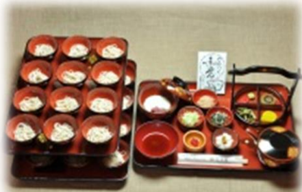
元祖盛り出し式わんこそば

お膳には一枚に12杯の小椀(ざるそば1人前の量)が乗っており、それを2段にしてお出ししております。さらに足りない方にはもう1枚分(3段目)をサービスいたしております。それをご自分のペースでゆっくりとお召上がりいただきます。