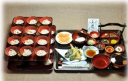
元祖盛り出し式わんこそば 特 (天ぷら盛り合わせ・デザート付)